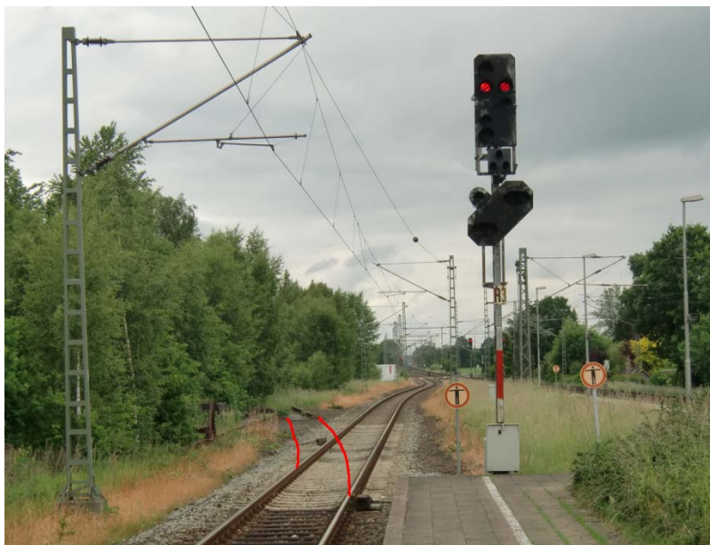
Alter/neuer Abzweig im Bf Wrist in Richtung Kellinghusen